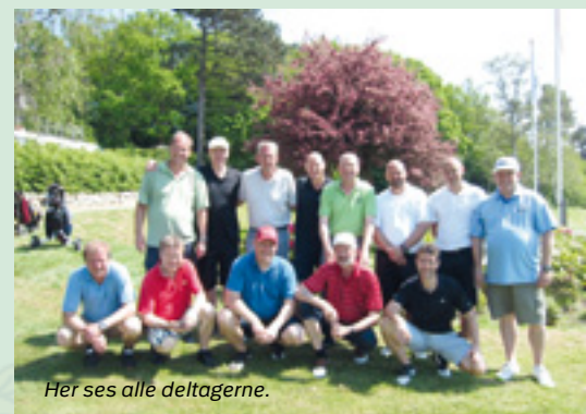
Her ses alle deltagerne.